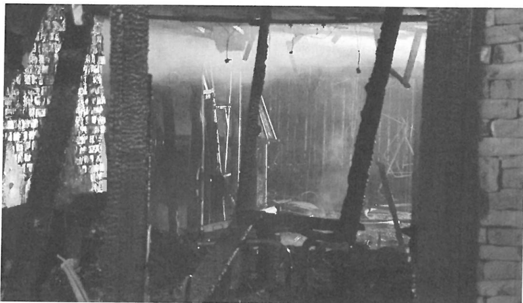
1. sz. kép: Szekszárd, Bródy köz 20.

Március 11-én Szedres, külterület, 15 hektáron nádas, sásos, bokros, fás terület égett, fokozat: II/K.