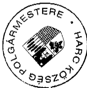
Siposné Csajbók Gabriella polgármester