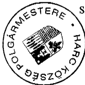
Siposné Csajbók Gabriella polgármester